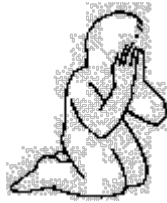
Precisamos "Morrer" Romanos 6:2, 6